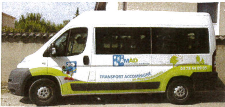
► Le transport accompagné connaît une activité croissante