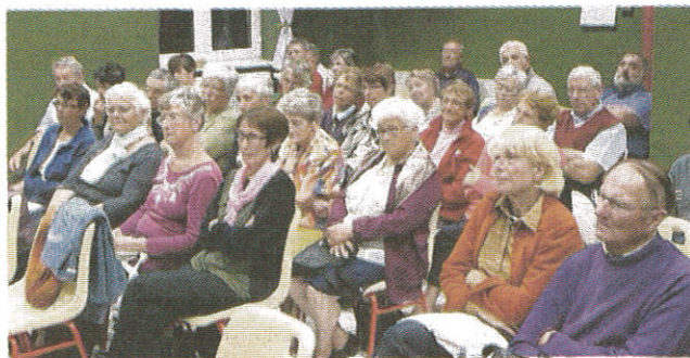
■ Les personnes présentes dans la salle sont venues pour comprendre quels sont les choix qui se présentent face à la vieillesse et la dépendance.

Pour l'ancien directeur, les deux solutions sont complémentaires. « Il n'y a pas de vérité. J'ai vu des placements